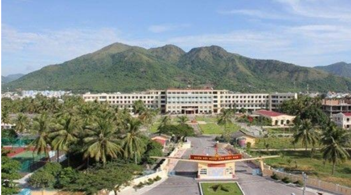
Trường Đại học Thông tin liên lạc, Thành phố Nha Trang